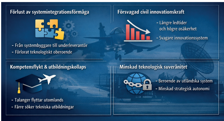
Figur 3. Risker och konsekvenser med en minskad förmåga att utveckla och producera avancerade stridsflygplan

Svenska beslutsfattare inom politik, akademi och näringsliv måste ta ställning till hur de stora försvarspolitiska satsningarna bäst omsätts i samhällsnytta. En central fråga är vad som står på spel om Sverige förlorar förmågan att utveckla och bygga egna stridsflygplan. Figur 3 sammanfattar olika risker och konsekvenser om Sverige tappar denna kompetens och vilka effekter det kan ha på näringslivet, universiteten samt på teknikspridning och spillover till företag och organisationer.